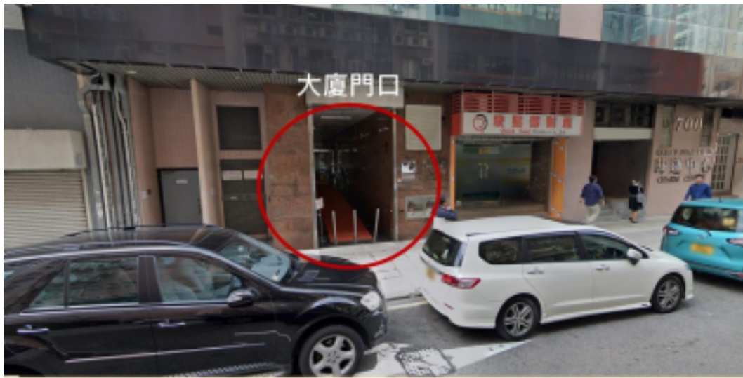
InnoAge Hub (荔枝角青山道700號時運中心1602室 - 荔枝角地鐵站C出口)